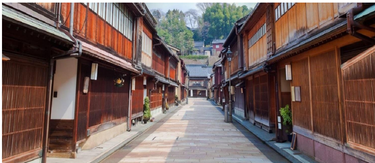
RUE DANS QUARTIER TRADITIONNEL DE KANAZAWA

Méconnue à tort des touristes étrangers, la ville est pourtant splendide. Grâce à son fort épanouissement durant la période Edo, la ville de Kanazawa possède une culture très raffinée. Une balade dans les anciens quartiers de samouraïs et de geishas Nagamachi et Higashi vous plongera dans le passé. Le quartier Higashi regorge de belles maisons de thé où ces jeunes femmes divertissaient leurs convives. Tout comme à Kyoto, c'est l'une des rares villes japonaises où il est encore possible de côtoyer d'authentiques geishas. Ce quartier historique est classé Patrimoine National Culturel. Nuitée à Kanazawa en chambre double avec petit déjeuner.