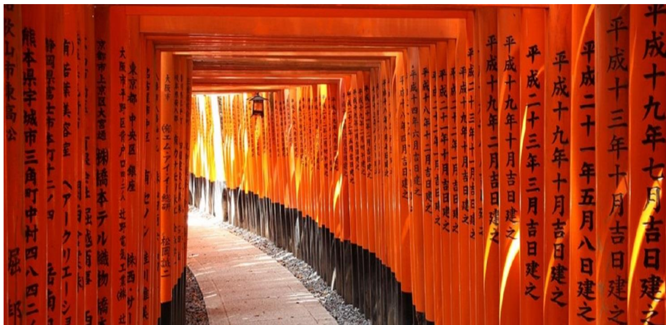
FUSHIMI INARI, KYOTO

Kyoto, un nom évocateur pour une cité hors du commun. Elle fut capitale du pays pendant près de 11 siècles. A travers le temps, elle a survécu à de terribles guerres et incendies, mais elle fut, grâce à sa valeur culturelle, épargnée pendant la 2 e guerre mondiale. On y trouve un nombre incroyable de temples, sanctuaires et jardins. Dès votre arrivée, nous vous recommandons la visite du sanctuaire Fushimi-Inari Taisha (à une station de la gare de Kyoto) connu pour son sentier de 4km couvert de 30 000 torii (portail shintoïste délimitant une zone profane d'une zone sacrée) formant ainsi un impressionnant tunnel rouge orangé et noir. Celui-ci est dédié à la divinité shintoïste protectrice des cultures de riz, Inari, dont la représentation est le renard. Nuitée à Kyoto en chambre double avec petit déjeuner.