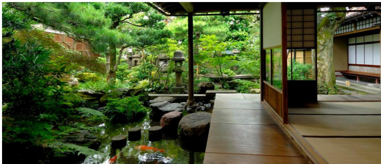
MAISON TRADITIONNELLE DE SAMURAI A KANAZAWA

Le jardin Kenroku-en est le point incontournable de la ville. C'est l'un des trois plus beaux jardins du Japon. Créé en 1676, ce jardin de 11 hectares était à l'époque le jardin extérieur du château de Kanazawa; de nos jours. Son nom, Kenroku-en, signifie "jardin des six éléments combinés" car le jardin possède six qualités: immensité, solennité, agencement minutieux, ancienneté, fraîcheur (du fait des eaux courantes qui le traversent) et charme des paysages. Kanazawa a également conservé ses traditions et son artisanat d'art qui ont tant contribué à sa renommée, tels que les splendides kimonos en soie Kaga-yuzen, les céramiques Kutani et Ohi, la dorure à la feuille d'or, les laques Wajima et le théâtre Noh... La ville abrite de nombreux musées intéressants où sont exposés diverses pièces artisanales mais aussi le musée d'Art du 21 ème siècle. Nuitée à Kanazawa en chambre double avec petit déjeuner.