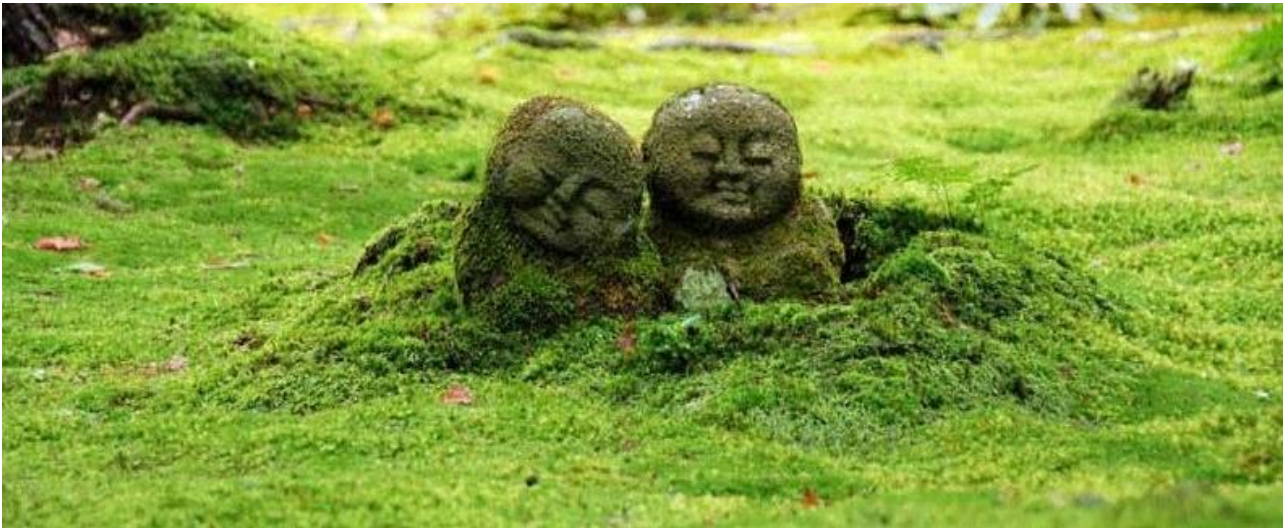
STATUES JIZO, PROTECTEURS DES AMES PERDUS QU'ON RETROUVE DANS DE NOMBREUX TEMPLES AU JAPON

Nous vous proposons de visiter les lieux les plus incontournables : Le temple Kinkakuji ou Pavillon d'Or situé au nord-ouest de Kyoto est sans doute le plus connu. Datant de la fin du 14 e siècle, ce temple abrite des reliques du Bouddha et est couvert de feuilles d'or. Le bâtiment actuel date de 1955 car l'original fut incendié par un moine fanatique en 1950. La seconde visite peut être consacrée au temple Kiyomizudera « Temple de l'Eau Pure », l'un des plus célèbres du pays. Il se niche sur les collines de l'est de la ville. Sa terrasse en bois offre une vue magnifique sur Kyoto . Ce temple tient son nom d'une petite source d'eau située en dessous de la terrasse. L'eau qu'on peut y boire a, selon la légende, des pouvoirs de guérison. En fin de journée profitez d'une balade au centre artisanal de la ville, et promenez-vous dans le quartier de Gion , le fameux quartier des geishas et qui sait, peut-être allez-vous en croiser ? Nuitée à Kyoto en chambre double avec petit déjeuner.