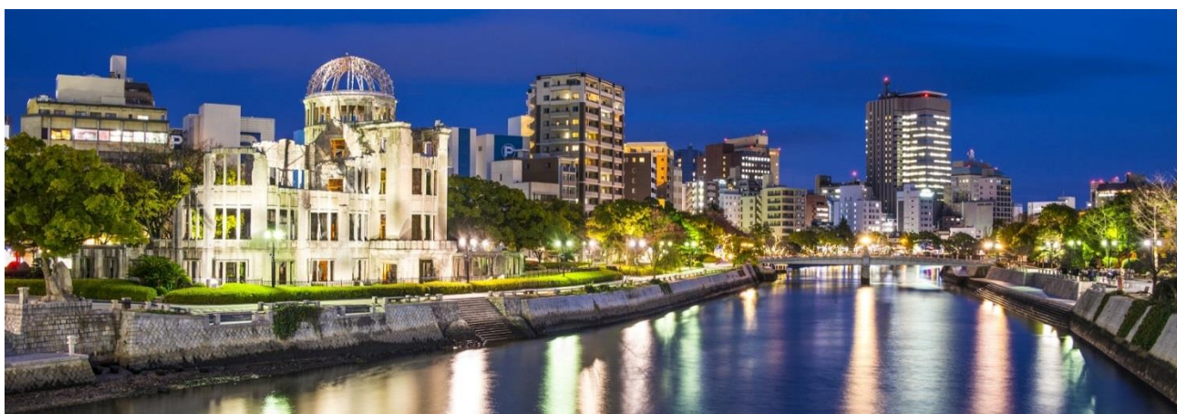
DÔME DE LA BOMBE A (UNESCO), HIROSHIMA

Malgré le temps et les années, la ville d'Hiroshima reste le témoin d'un fait unique dans l'histoire, un traumatisme mondial, celui du premier bombardement atomique. La puissance et l'atrocité d'une bombe nucléaire dévoilée au grand jour, à l'humanité... Bien que la ville soit entièrement reconstruite et restaurée, elle conserve l'aura unique d'une ville mémorial d'un souvenir du passé. Les japonais ont su faire d'Hiroshima une ville « emblème du pacifisme » tournée avec conviction vers l'avenir. Nous recommandons la visite du parc du Mémorial de la Paix conçu par le célèbre architecte japonais Kenzo Tange et du dôme de la bombe A classé à l'UNESCO. Nuitée à Hiroshima en chambre double avec petit déjeuner.