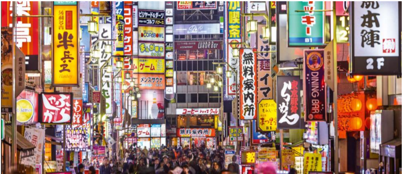
RUE DE TOKYO

ARRIVÉE À L'AÉROPORT, ACCUEIL ANGLOPHONE PUIS TRANSFERT VERS VOTRE HÔTEL EN BUS-NAVETTE. Bienvenue à Tokyo, anciennement nommé Edo, ville fascinante de par son dynamisme et le nombre d'activités qu'elle offre à ses visiteurs. Nuitée à Tokyo en chambre double avec petit déjeuner.