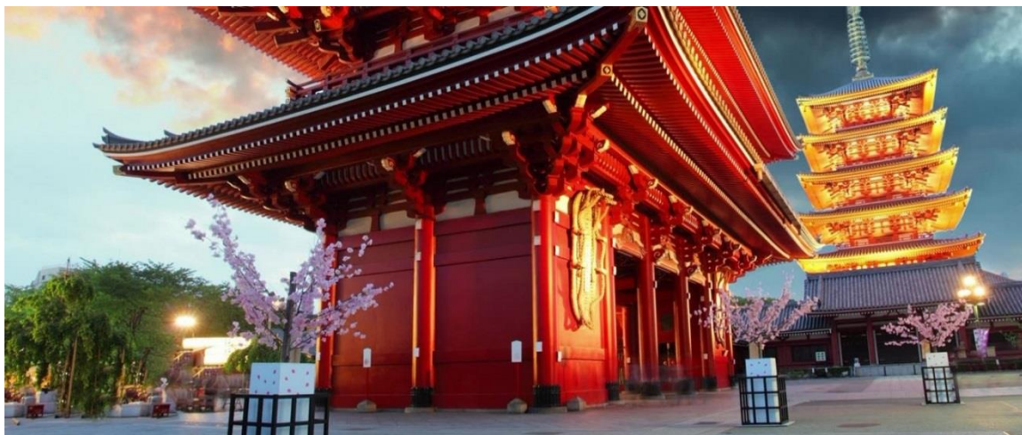
TEMPLE SENO-JI, TOKYO

Nous vous recommandons la visite du quartier traditionnel Asakusa et de son temple Senso-ji qui est le temple shintoïste le plus vénéré de la ville. Il abrite une statue en or de Kannon, la déesse bouddhique de la compassion. La rue menant au temple, Nakamise , est bordée de petites échoppes, où vous trouverez de nombreux souvenirs. Profitez de la soirée pour apprécier la vue magnifique qu'offre la Tokyo Sky Tree , 2 ème plus haute tour du monde, construite par l'architecte Tadao Ando. Nuitée à Tokyo en chambre double avec petit déjeuner.