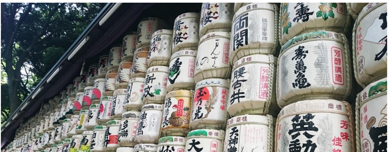
SAKE MEIJI JINGU, PARC YOYOGI

Plongeon dans l'effervescence de la vie tokyoïte. Tokyo , capitale ultra-moderne du Japon, vous séduira par son savoureux mélange de tradition et de modernisme. Il est facile de s'y déplacer grâce à la ligne Yamanote qui fait le tour de la cité et aux lignes de métro qui sillonnent le centre. À ne pas manquer, la partie ouest de Tokyo. Au cœur du parc de Yoyogi se cache le sanctuaire Meiji. Sur votre chemin, vous croiserez une rangée de fûts de saké et vin, offerts au sanctuaire par de généreux donateurs. De nombreuses cérémonies se déroulent en ce lieu dont des défilés ou d'extraordinaires démonstrations de yabusame , technique de tir à l'arc japonaise, pratiquée à cheval. A proximité, la ruelle animée Takeshita attire la jeunesse tokyoïte qui se fournit ici en vêtements extravagants. En soirée profitez du quartier Shibuya, connu dans le monde entier pour son fameux carrefour et sa statue du chien Hachiko . Nuitée à Tokyo, chambre double avec petit-déj.