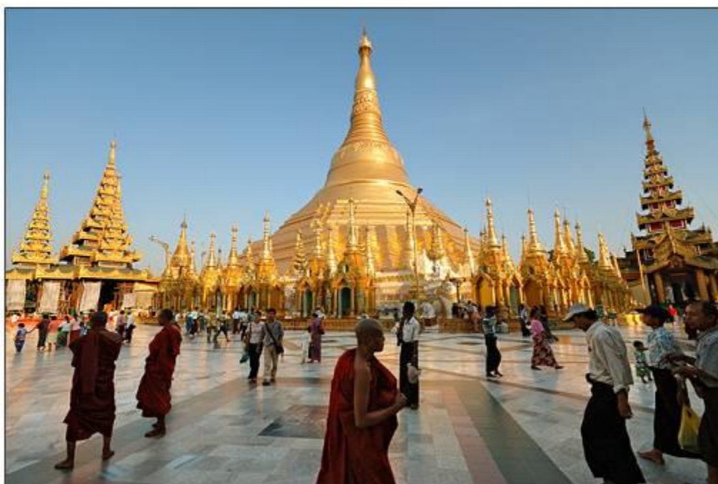
La magnifique pagode de Shwedagon, Yangon

Au coucher du soleil, découverte de la majestueuse pagode Shwedagon, dont le dôme doré domine la ville. De plus de 100 m de hauteur, la plus grande mais aussi la plus célèbre pagode du Myanmar domine la ville de Yangon. Elle impressionne par son éclat doré, son élégance mais aussi par sa construction majestueuse.