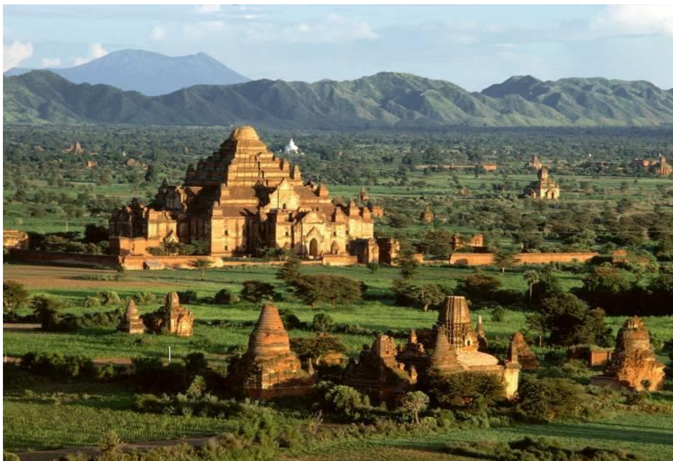
La plaine de Bagan après la saison des pluies